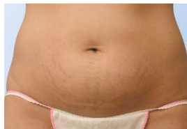
▲ nach 12 Behandlungen