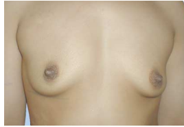
▲ nach 1 Behandlung