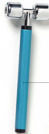
Mini-Doppelroller Hals, Wangen

Daneben verfügt beautytek über Programme zur allgemeinen Stressreduktion. Die Verteilung der Energie in der Behandlungsregion kann visuell in einem energetischen Mapping vor und nach Therapie abgeleitet und für den Kunden optisch effektiv dargestellt werden.