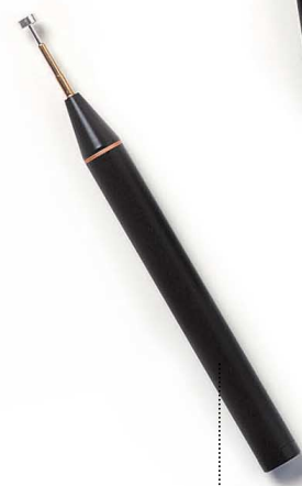
Y-Sonde Hals, Wangen, Brust