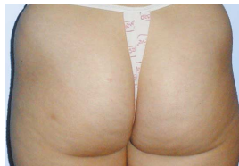
▲ nach 3 Behandlungen