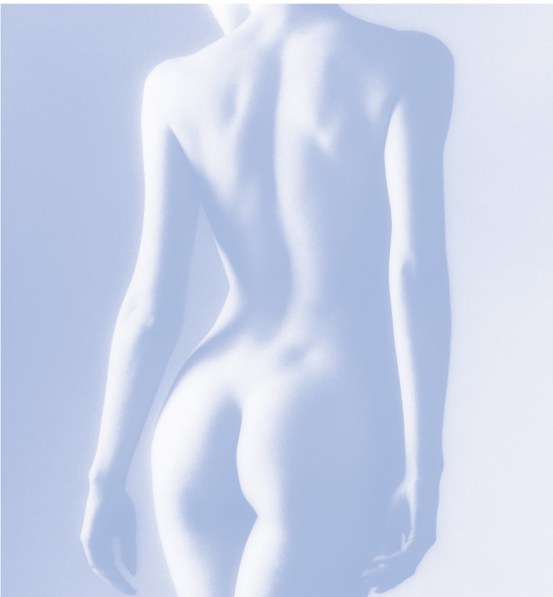
Sichtbare und dauerhafte Therapieerfolge für Ihre kosmetische Praxis