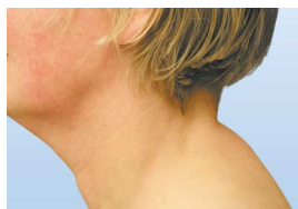
▲ nach 15 Behandlungen